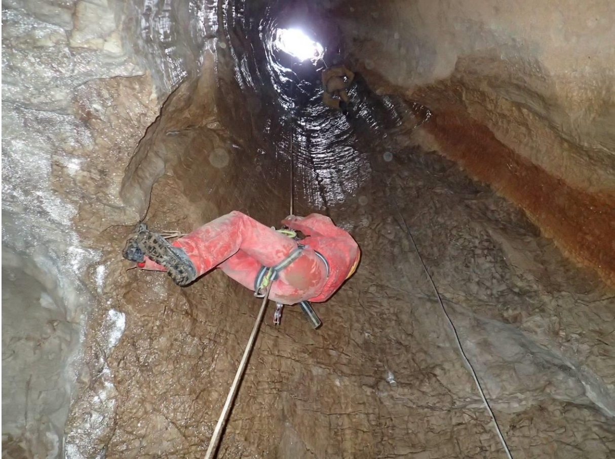
Puits d'entrée de 22 m du Creux du garde

La pratique en gymnase donne une certaine aisance et confiance qui se trouve mis à mal en milieu naturel où il devient nécessaire de rassurer. On est comme dans deux mondes différents.